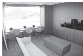
個室III(定員6名)車いす利用可 7,000円